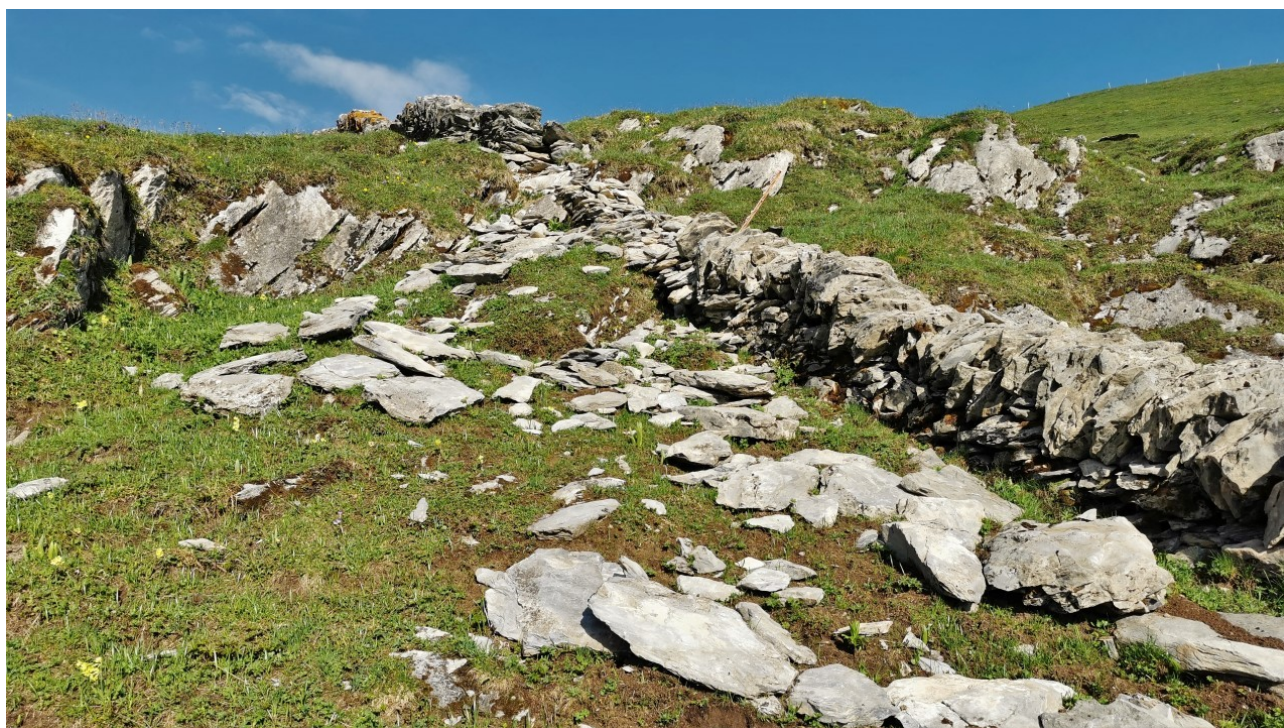
Stark beschädigtes Teilstück der Grenzmauer