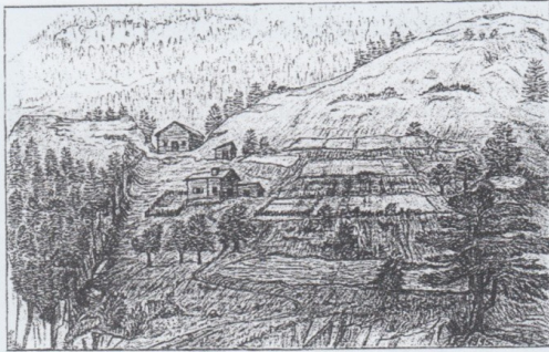
Fantasievolle Darstellung zu einer ehemaligen Siedlung auf der Fenza BILD: JAKOB KRÄTTLI

und Schweine. Der Ackerbau war auch sehr wichtig, die vorhin erwähnten Terrassen waren grösstenteils Ackerboden, worin vorwiegend Getreide angebaut wurde. Die von Jakob gezeichnete Darstellung zu der ehemaligen Siedlung ist als Fantasie zu verstehen, zumal Jakob sich auch himmlische Frauen mit Krügen auf der Fenza vorstellte, diese sind auch in der vorhin gezeigten Darstellung zu dem Abbau der Fenza zu sehen und entspringen aus Raffaels Gemälde «Der Brand von Borgo». «Im Satz», an der Grenze zum Nachbardorf Haldenstein, ein Gebiet über das man sich einst gestritten haben soll, befand sich in steilem Gelände ebenfalls eine Terrasse. Diese hatte einen Grund, denn der «Satzbach» war unmittelbar nördlich davon gelegen. Das Wasser dieses Baches, welches einer guten Quelle entsprang, wurde vermutlich herangeleitet zur Bewässerung der davor erwähnten Acker. Jakob fand bei seiner Suche verschiedene Gräben in denen das Wasser herbeigeleitet worden sein könnte. Er fand auch an manchen Stellen eine Vertiefung im Boden, eine rundliche Grube, diese waren vermutlich Speicherbecken, ein einfacher Brunnen. Diese Informationen sind als Vermutung von Jakob anzusehen.