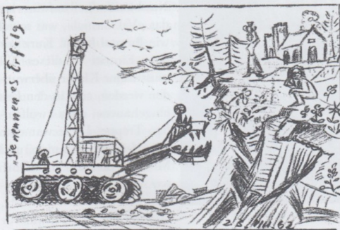
Darstellung zu dem Abbau der Fenza

Im Abstimmungsverfahren entschied man sich für den Verkauf des Berges, der ehemals auch den südöstlichen Wind abhielt. Dies brachte aber auch viele Vorteile, denn mit dem Verkauf wurde die wirtschaftliche Lage des Dorfes deutlich angehoben, auch heute bringt die Zementfabrik viele Arbeitsplätze ein.