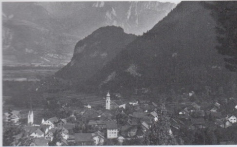
Untervaz 1950

Am Ende des Tales gabelte der Weg sich in drei Richtungen auseinander. Nach Süden zur Ruine Neuenburg. Der mittlere Pfad, angelegt zur Zeit des 2. Weltkrieges, führte zu der «Wingertlhalde».