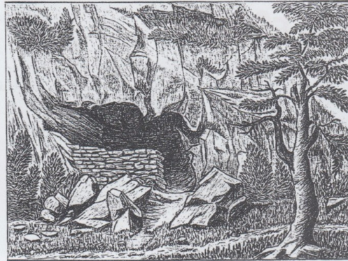
Zeichnung der Höhle im Val Castiel, Jakob Krättli BILD: JAKOB KRÄTTLI

«... grub ich ein zweites Loch..., dem besterhaltenen Punkt des vermuteten Grundrisses... es brauchte nur wenig Mühe - und schon kam das erwartete Gemäuer zum Vorschein. Die nun sichtbar gewordene Mauerecke besteht aber aus gar nicht schweren Ecksteinen... aus verhältnismässig sehr kleinen Steinen gebaut. Das anfänglich knietiefe Loch wurde zu einem langsam immer länger und tiefer werdenden Graben... kamen diese Sachen ans Licht: Ein flacher, handbreiter Stein, schön ellipsenförmig; Knochenbruchteile... eine Unterkieferseite... - wohl von einer Ziege oder einem Schaf; zudem eine haselnussbraune Keramikscherbe... ... übereinanderliegende Schichten von Ablagerungen deutlich sichtbar. Darin erkennt man einen dünnen vorwiegend grauen Streifen - wohl Asche - ... Dass es sich dabei um Rückstände eines einstigen Feuers handeln muss, bezeugen auch die diesen Schichten inne liegenden angeschwärtzten Steine... Bei der hereinbrechenden Abenddämmerung war nun der Erfolg des Tages zugegen, indem ein Jahrhundertaltes Geheimnis ans Licht unserer jetzigen Zeit aufzusteigen schien. Weil mein Rucksack... schon vollgestopft war, trug ich meine gefundenen «Schätze» im Hute heim - vorsichtig und ehrfürchtig. - Ja, ich trug die Schätze im Hute heim!» Jakob Krättli, Tagebucheintrag aus «Ob und Nid der Felsentreppe»