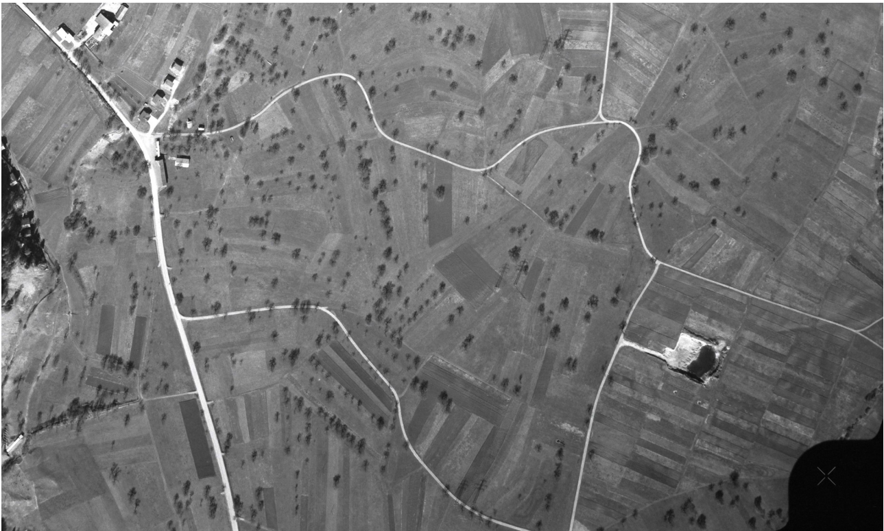
Kiesgrube Herti (unten rechts) auf einem Luftbild von 1961, links oben der Tuf