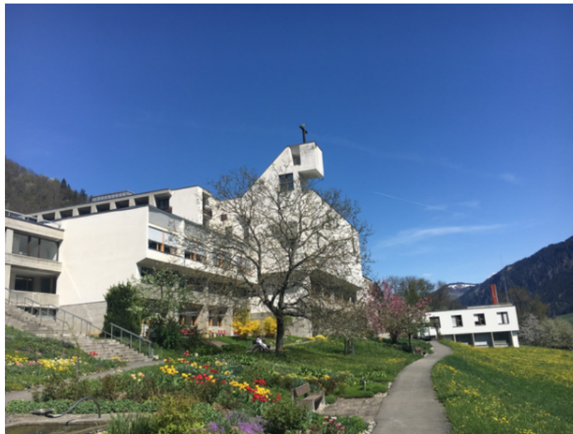
Eintritt ins Kloster Ilanz am 5. Februar 1955