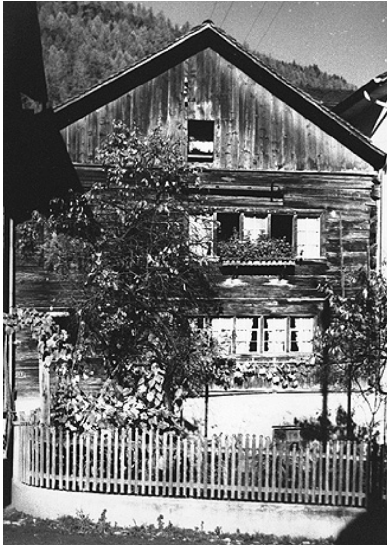
Ihr Elternhaus, Haus Hug an der Hintergasse