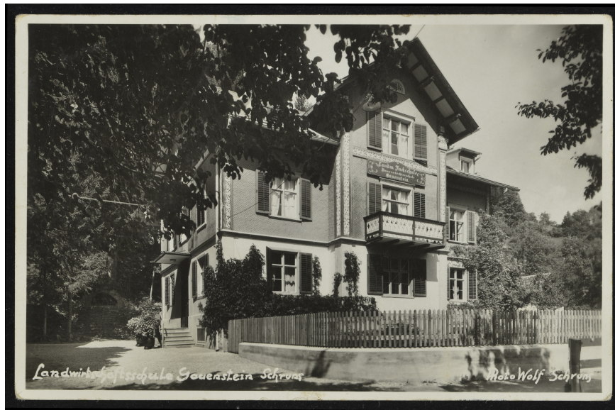
Landwirtschaftliche Haushaltungsschule Gauenstein in Schruns