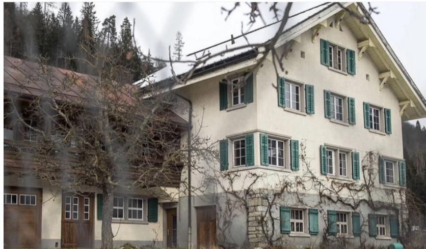
Der Albertushof, einst mehr als ein Jahrhundert lang der Selbstversorgungsbetrieb des Ilanzer Dominikanerinnenklosters. Schweren Herzens hat sie miterlebt, dass wir den «Albertushof» verpachten und den dortigen Schwestern-Konvent auflösen mussten.